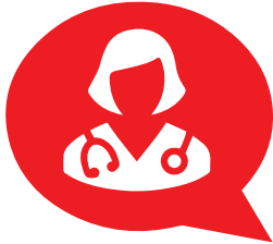
Sib Tham Nrog Koj Tus Kws Kho Mob txog Koj Qhov Mob

Cov tshuaj loog mob tsim muaj taus kev raug mob los sis tuag taus thaum twg siv tsis yog los sis siv txhaum. Rhais cov kauj ruam los tiv thaiv koj tus kheej thiab cov neeg koj hlub.