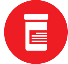
Noj Raws Cov Kev Qhia Koj Cov Tshuaj Loog Mob