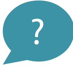
Nug Ua Ntej Koj Noj Cov Tshuaj Yeeb