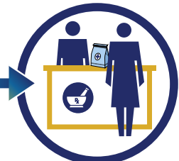
Matanggap ng pasyente ang interchangeable biosimilar