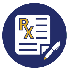
Iresetang doktor ang reperensiyang produkto