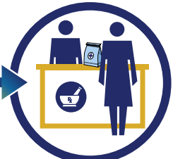
Bệnh nhân nhận được thuốc tương tự sinh học có thể hoán đổi