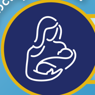
မိခင်နို့တိုက်ခြင်း