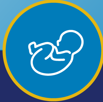
လမစေ့ဘဲ မွေးဖွားလာခြင်း