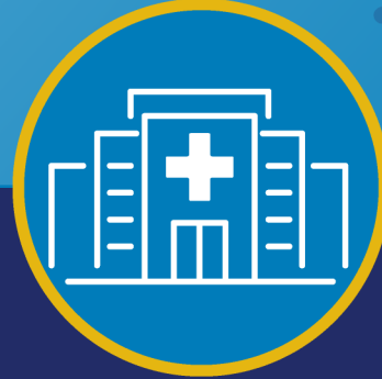
ဆေးဝါးကုသမှု ခံယူခြင်း - ဥပမာ ကင်ဆာအတွက် ဓာတုကုထုံး

သင့်ကလေးသည် အစာကြောင့်ဖြစ်သော ရောဂါဖြစ်နိုင်ချေ ပိုများပါက အောက် ပါတို့ကို ဆင်ခြင်ပါ။