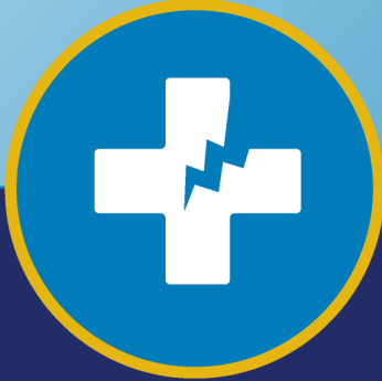
အားနည်းသော ကိုယ်ခံအားစနစ်