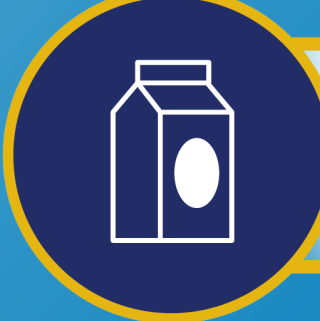
အရည်အပျစ်