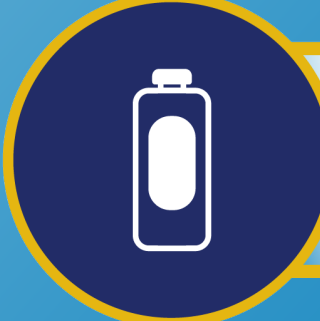
အသင့်တိုက်ကျွေးနိုင်သော